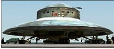
Haunebu II 1944/45 Neuschwabenland